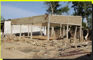
J1 Lundi...LES MURS